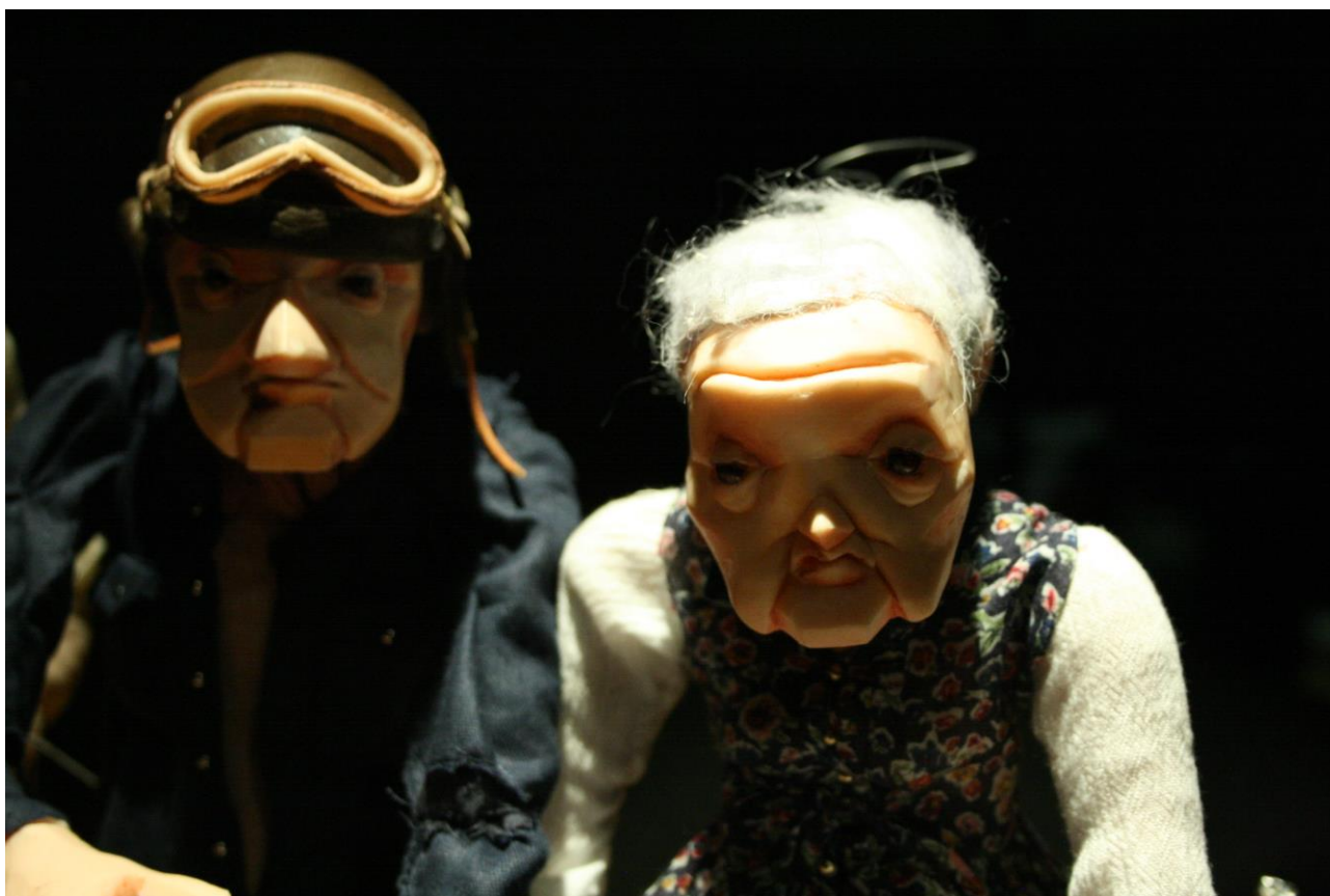
Travaux en cours

Au sein même des marionnettes, deux esthétiques se complètent : les marionnettes de l'intime, manipulées sur table et à vue privilégient l'utilisation du tissu (matériau de prédilection de Rose, couturière). Le tissu nous ramène au quotidien mais aussi à la féminité. Une grande force de ce texte est de donner à réaliser ce qu'a été cette guerre à travers le vécu de Rose. La guerre vécue par les femmes est trop rarement évoquée. Adieu Bert nous permet de palier à ce vide. Volontairement esthétisées, les marionnettes traduisent la candeur des personnages et leur humanité.