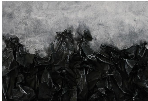
Réalisation : Sofie Olleval