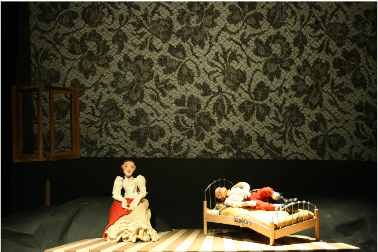
Travaux en cours

La scénographie suit cette même logique. Deux espaces de jeu se dessinent: un espace en avant-scène sur une table de manipulation qui se transforme pour représenter différents décors, propices à un récit intime. Ce lieu sera successivement une chambre, une salle de bal, un peloton d'exécution. Les scènes collectives, elles, sont jouées sur un grand écran de projection d'ombres, lieu d'exposition des événements de la Grande Histoire (les tranchées, les mines de charbon ...) Ces différents espaces sont perméables et un dialogue s'y installe, comme un va-et-vient entre la guerre à l'échelle d'un homme et à celle de l'humanité.