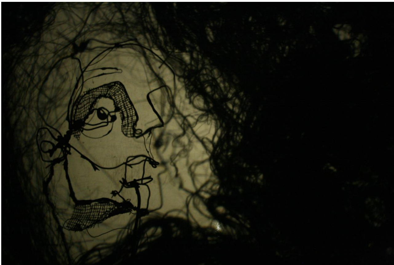
Travaux en cours

D'autres marionnettes racontent des personnages dans l'au-delà. Soldat mort à la guerre ou galibot enseveli lors d'une catastrophe minière, ils seront traités par le biais de l'ombre et leur esthétique fait référence à la fois aux travaux de Calder et aux encres de Florent Cordier.